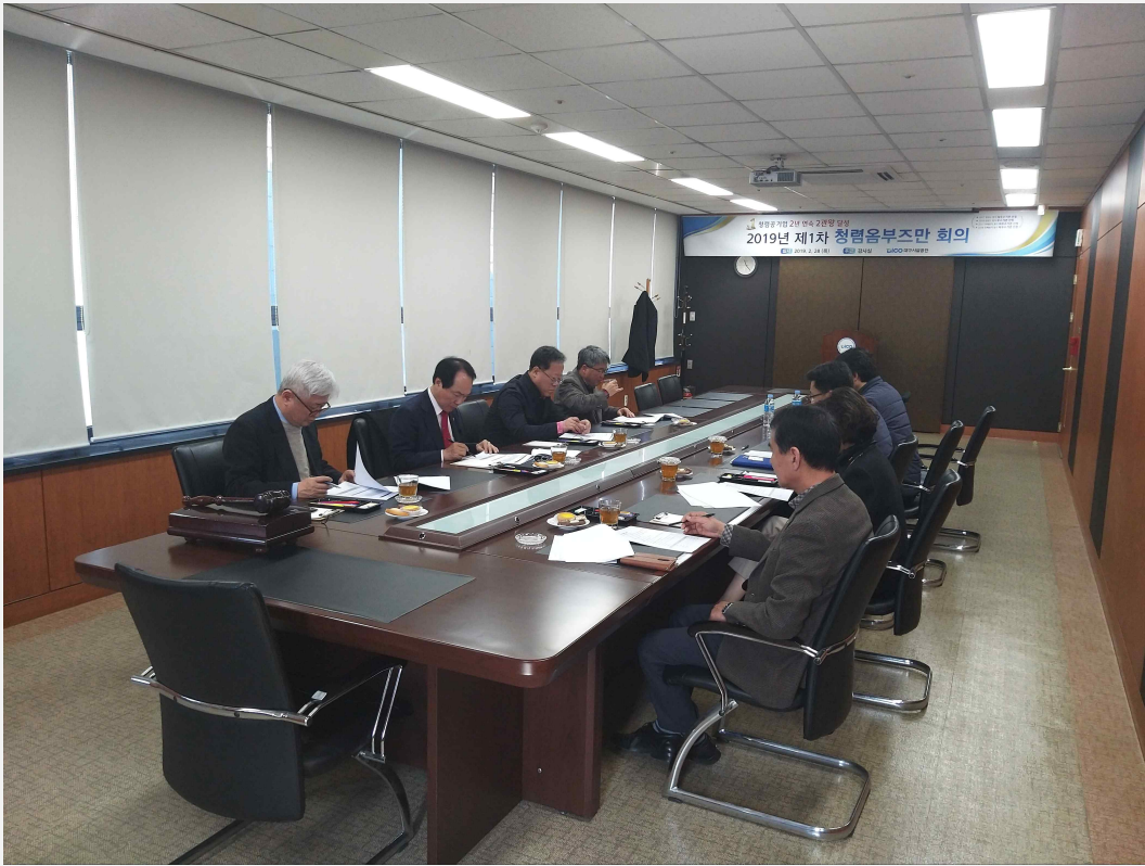
2019년 제1차 청렴옴부즈만 회의